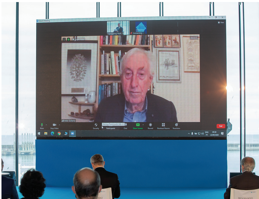
Peter Doherty, um dos maiores especialistas do mundo em pandemias.

"Ainda são bastante desconhecidas as marcas que pode deixar o Covid19 no organismo"