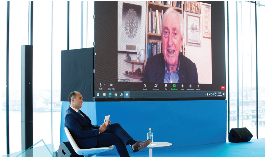
O Prémio Nobel e Australiano do Ano (1997) elogiou o evento "Connecting Healthcare".

A maioria dos epidemiologistas pensa que a "imunidade de grupo" deve ser aplicada para a Covid-19 quando cerca de 60 por cento das pessoas foram infetadas. Algumas regiões, como o Brasil, onde houve intervenção mínima do Governo, chegarão a esses números mais cedo do que outras nações. Essas "experiências naturais" estão a ser observadas de perto. Mas é óbvio que isto só pode chegar ao fim para a maioria