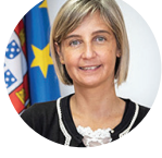
Marta Temido Ministra da Saúde de Portugal