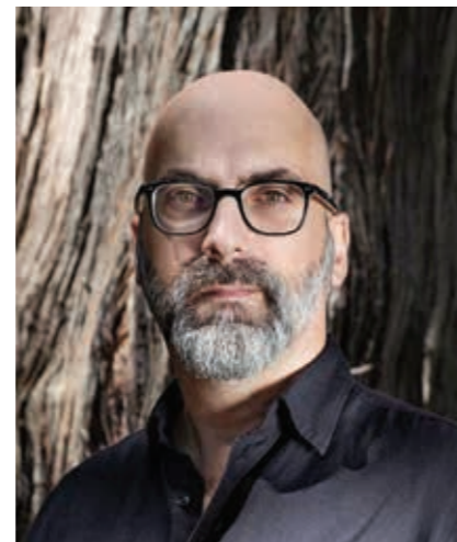
Valter Hugo Mãe.